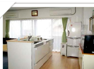
毎日こちらのキッチンでご利用者様と一緒におやつを作っています。