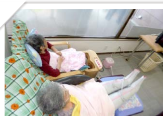
エアマッサージャー・足湯