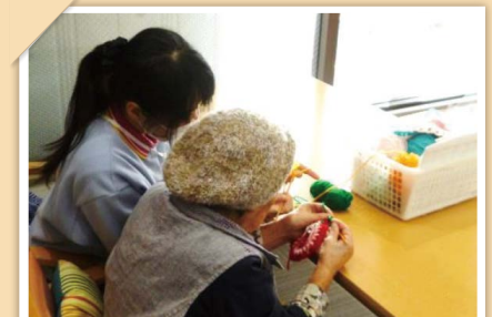
個別アクティビティ