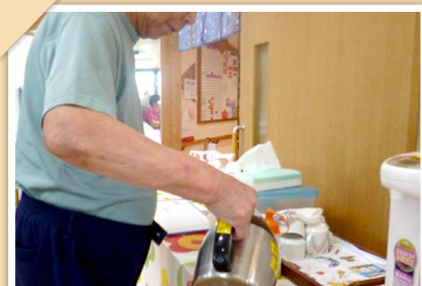
脳トレ (トランプ等)